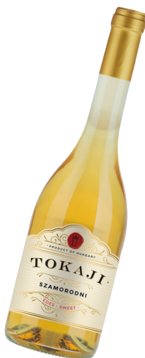
TOKAJI Szamorodni OEM édes Tokaji palack