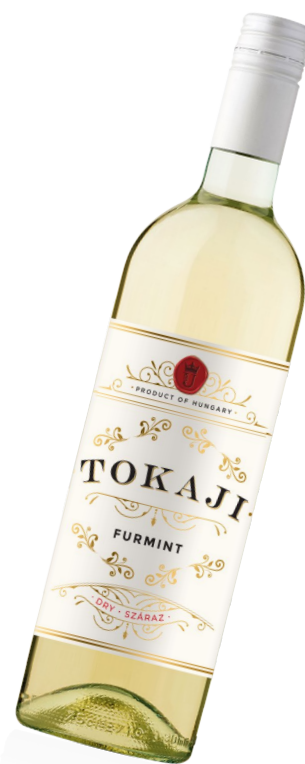
TOKAJI Furmint OEM száraz bordeaux palack