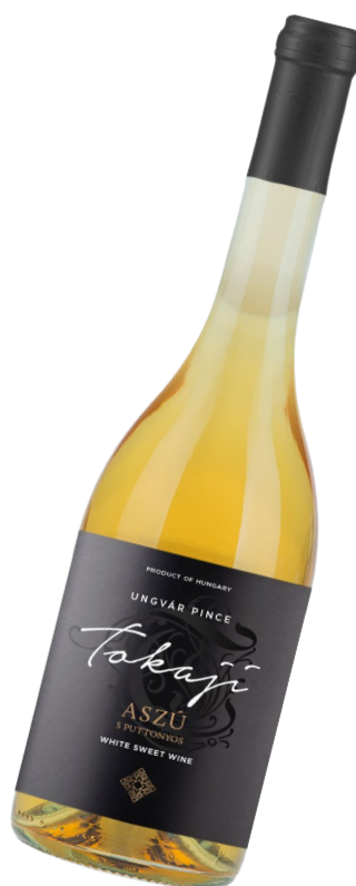
TOKAJI Aszú 5 puttonyos